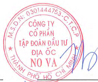
Bùi Xuân Huy Người đại diện theo pháp luật Ngày 14 tháng 8 năm 2020

Các thuyết minh từ trang 10 đến trang 64 là một phần cấu thành báo cáo tài chính riêng giữa niên độ này.