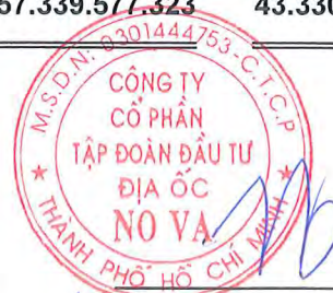
Bùi Xuân Huy Người đại diện theo pháp luật Ngày 14 tháng 8 năm 2020

Các thuyết minh từ trang 10 đến trang 64 là một phần cấu thành báo cáo tài chính riêng giữa niên độ này.