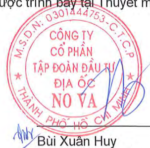
Bùi Xuân Huy Người đại diện theo pháp luật Ngày 14 tháng 8 năm 2020

Các thuyết minh từ trang 10 đến trang 64 là một phần cấu thành báo cáo tài chính riêng giữa niên độ này.